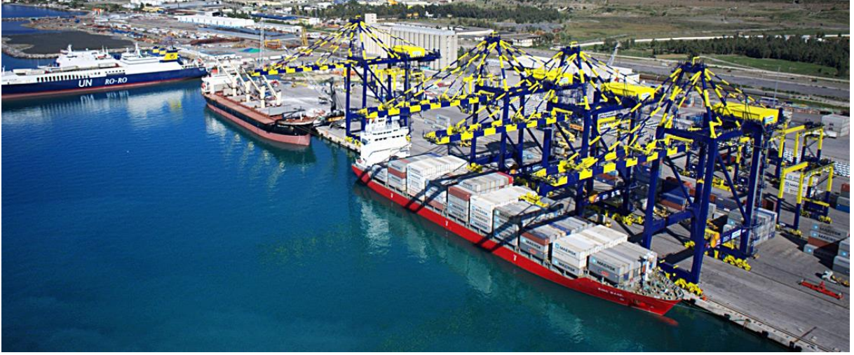
Şekil2. Iskenderun Limanı mevcut durumu gösteren fotoğraf

Proje, mevcut liman faaliyetleri devam ederken, aşamalı inşaat yöntemi ile mevcut liman yapılarının iyileştirilmesini içermektedir. Önerilen projenin bir parçası olarak aşağıdaki temel faaliyetler tamamlanmış/devam etmekte/planlanmaktadır: